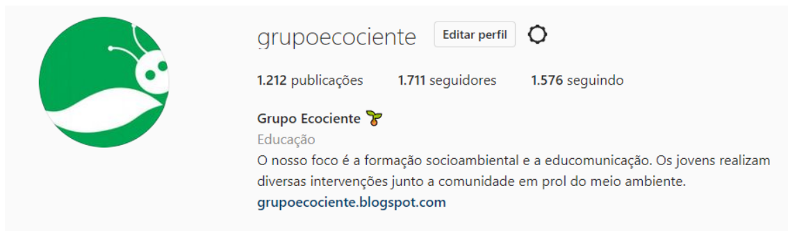
(Nosso perfil no Instagram)

Também fizemos 2 posts no nosso perfil do tiktok ( https://www.tiktok.com/@grupoecociente ) e conseguimos 65 curtidas e 113 visualizações somando os dois vídeos, além de 9 novos seguidores (imagem 5).